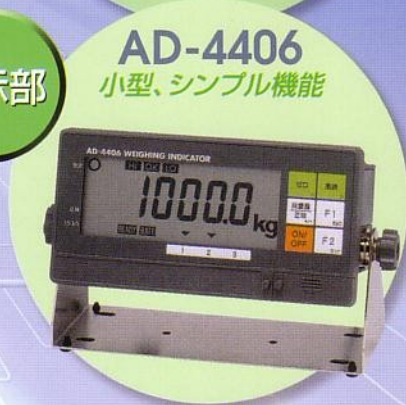
AD-4406 小型、シンプル機能